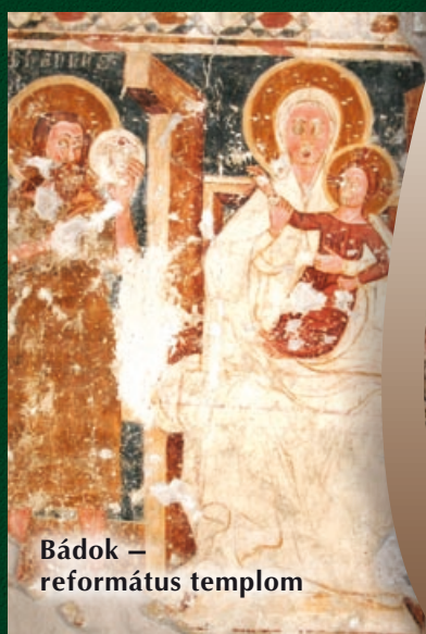
Bádok – református templom