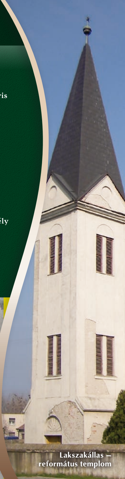
Lakszakállas – református templom