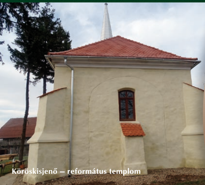
Kőröskisjenő – református templom