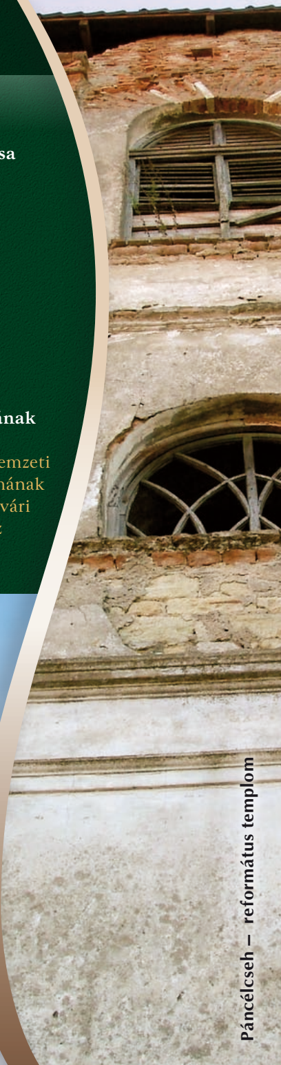
Páncélcseh – református templom