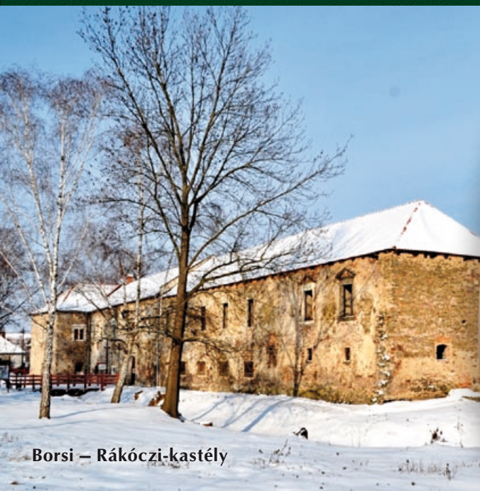
Borsi – Rákóczi-kastély