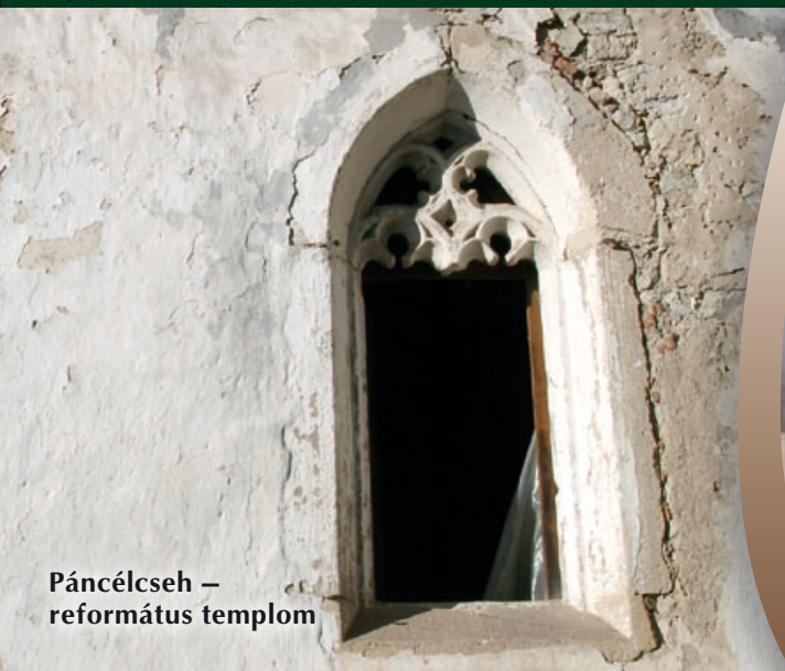
Páncélcseh – református templom