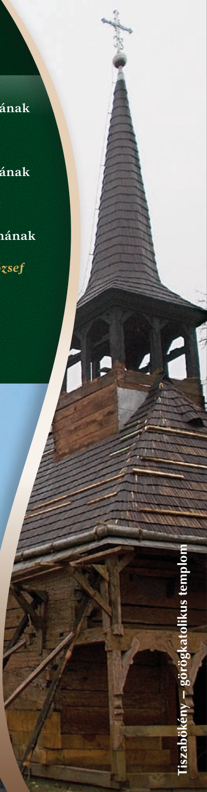
Tiszabökény – görögkatolikus templom