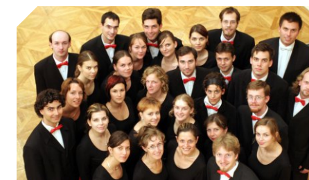
Gaudeamus kórus (Brno) / Gaudeamus Choir (Brünn)