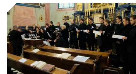
Sankt Barbara kórus (Krakkó) / Saint Barbara choir (Cracow)