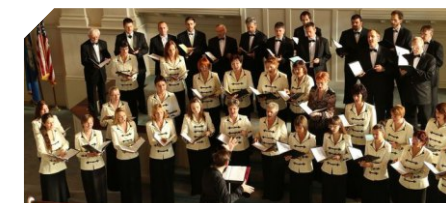
Szlovákiai Magyar Pedagógusok Vass Lajos kórusa (Pozsony) Lajos Vass Choir of Hungarian Teachers in Slovakia (Bratislava)