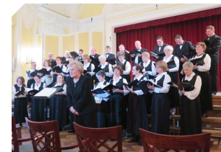
Országos Széchényi Könyvtár Kórusa The Choir of the National Széchényi Library