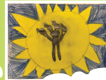
12. A nap háta mögött