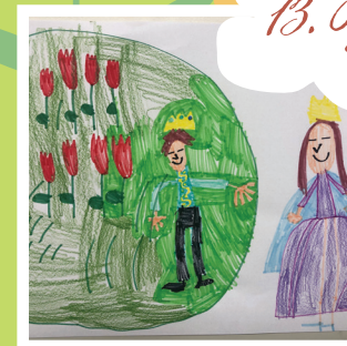
13. Virágos bódé